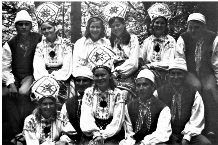
Pildil noorem segarühm.

1969. a Eesti 100-nda juubeli laulupeol tantsisime Lauluväljaku lava treppidel ja Lillepaviljonis.