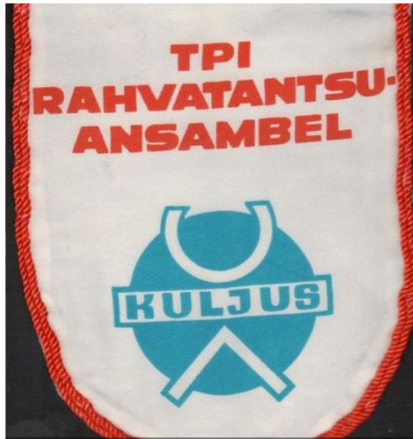
Pildil Kuljuse embleem