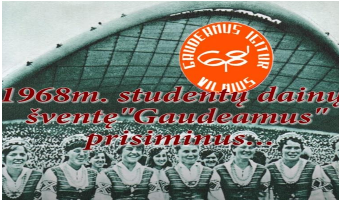
Pildil Vilniuse Gaudeamuse peo reklaam.