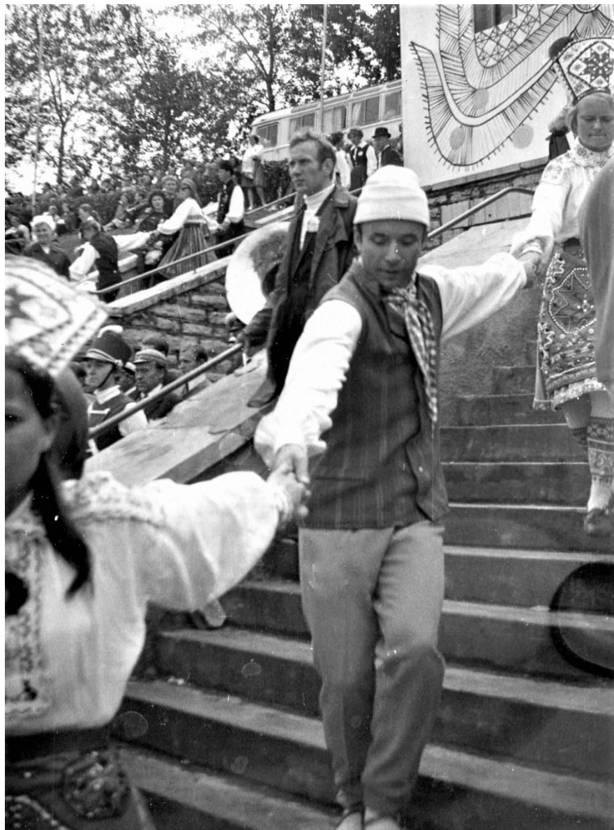
Pildil sisseminek Komsomoli (Kalevi) staadionil 1970.