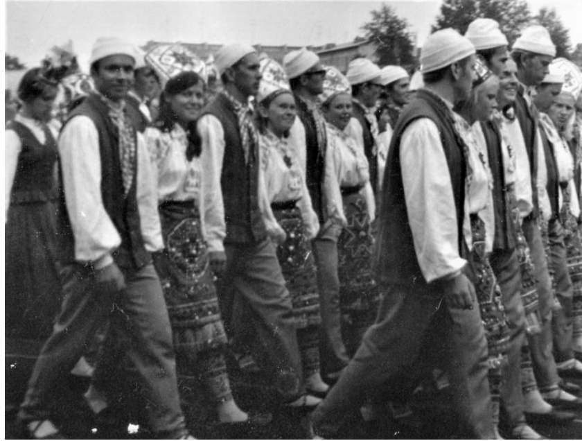
Pildil lõpuring Komsomoli (Kalevi) staadionil.