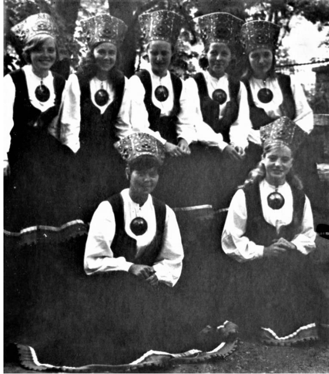
Pildil naisrühma liikmeid.

III tudengite laulu- ja tantsupeo üritused Tartus 3200 osalisega on kogu eluks silme ees. Tartlased elasid kõigele väga emotsionaalselt kaasa. Tantsijatel jätkus energiat lisaks trennile, rongkäigule ja esinemistele veel ööselgi möllata. Näiteks kõndisime öösel üle Emajõe jalakäijate silla kaare, kätest kinni hoides.